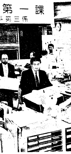
横浜市財政局に家宅捜索に入り、押収した資料を運び出す県警捜査員