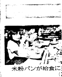
米粉パンが給食に

二ホンシカ雌100頭 （殺処分する）を盛り込んだ本年度 の保護管理事業計画をまとめた。安住 の地でシカが捕獲されるのは初めて