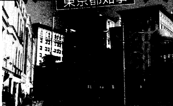
ピバリーヒルズの中心にある「リージェント・ピバリー・ウィルシャー」＝土方細秩子写す

側近。知事本局の職員は報道対応や経理事務を担当するという。典子夫人は何のために同行するのか。「国際儀礼上の必要性からです。向こうの公園長や日系人団体から『ご夫婦でどうぞ』と招待があったので」(前出・内藤参事) だが若林氏はこう語る。「文京区議の海外視察では、訪問先に頼み込んで招待状を出してもらい、夫人同伴