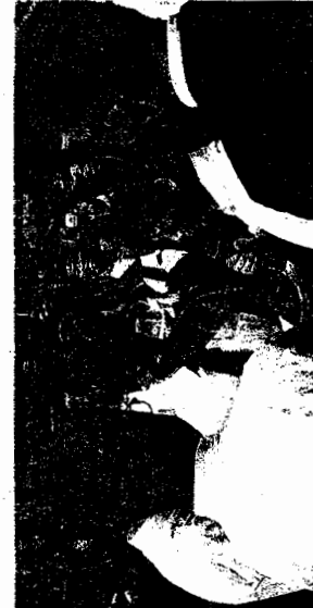
今年8月、このように話し合う場面が、各校でよく見られるようになった。