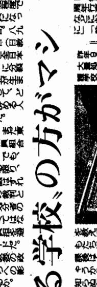
今年8月、このように話し合う場面が、各校でよく見られるようになった。