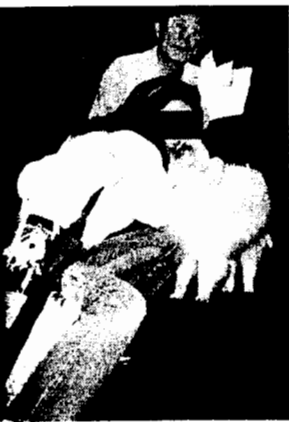
米長氏は「君は女神様が引き合わせてくれた」と