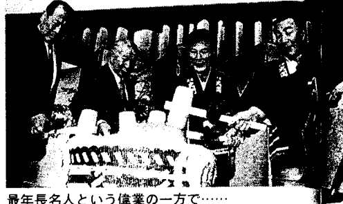
最年長名人という偉業の一方で……

その時初めて行く先を告げられたんです。米長さんは、うれしそうにチェックインすると、